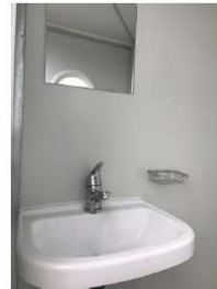
Lavabo avec miroir et porte savon dans le SAS propre