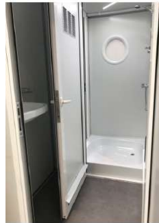
Douche à évacuation automatique

L'évacuation des eaux de la douche est automatique Grâce à un pressostat couplé à une pompe d'évacuation