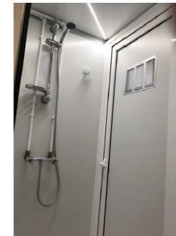
Douche avec accessoires

Zone technique avec chauffe-eau, pompage, filtration et extracteur d'air