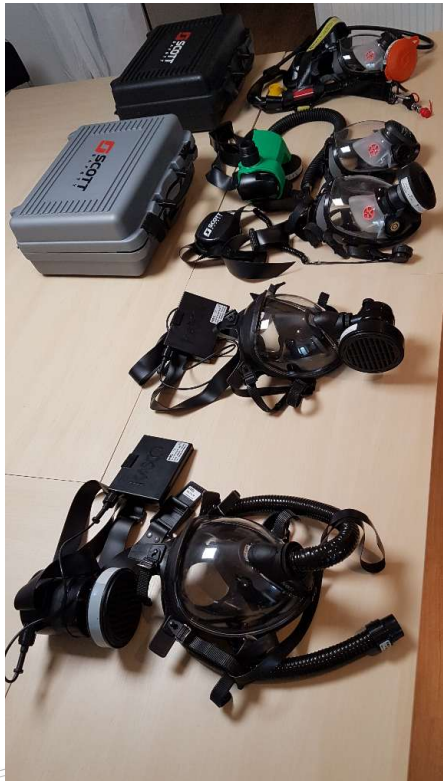
Masques à ventilation assistée KASCO